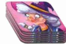
마녀의 재료 토큰 6개